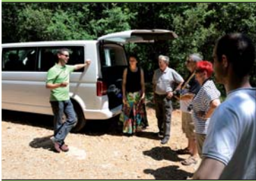
Transport by air-conditioned mini-bus (8 seats) Transport en minibus climatisé (8 places)

Nous organisons pour vous une formule "tout compris" (*) avec accompagnement hors des sentiers battus. Découvrez les paysages contrastés de l'Ardèche, ses villages et sites naturels commentés par des guides professionnels. Venez à la rencontre de producteurs locaux pour déguster leurs produits.